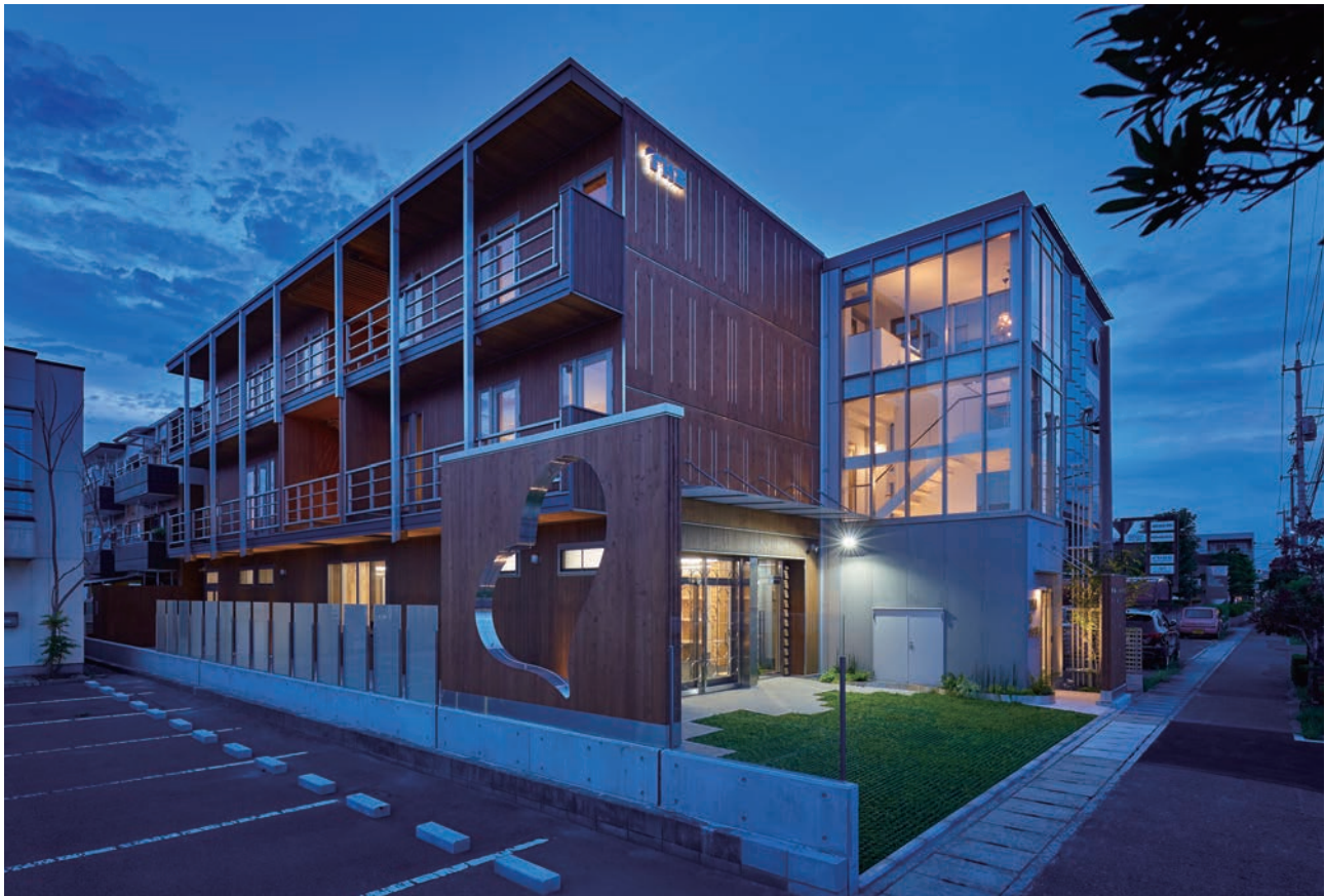
東側からの外観（夕景）