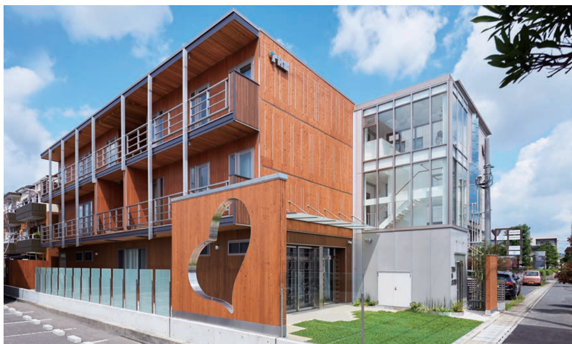
東側から見た外観