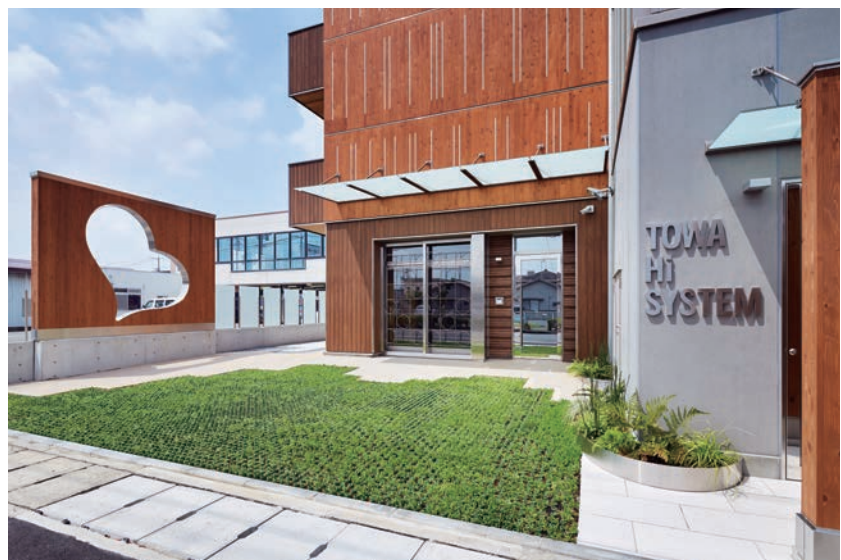
エントランスまわり外観