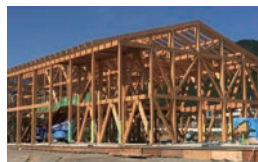
カラマツ集成材使用