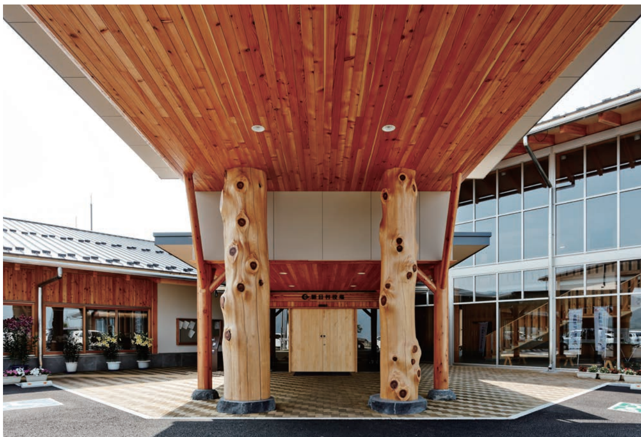
エントランス外観