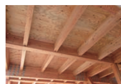
信州型接着重ね梁