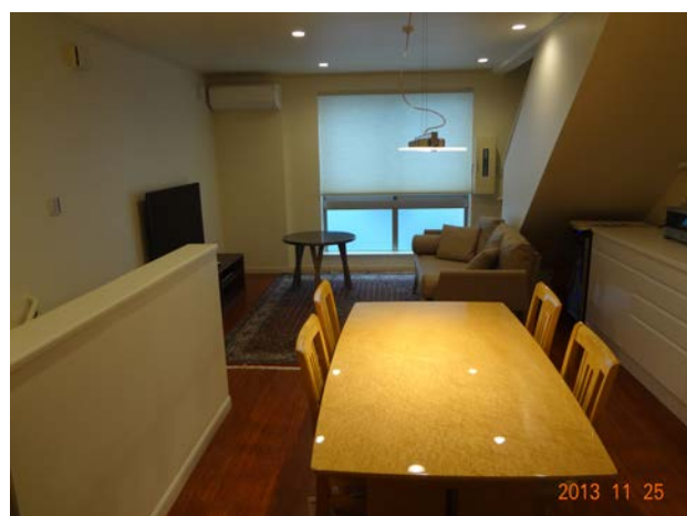
4、5階はメゾネット住戸