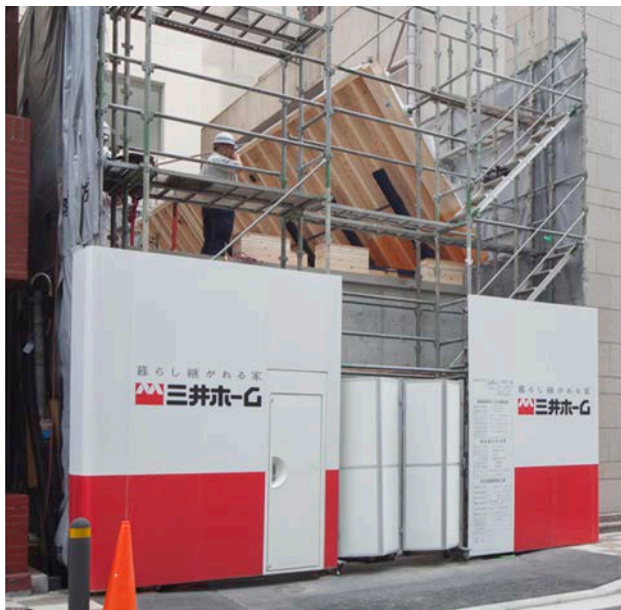
2階外壁の建て起こし中の外観