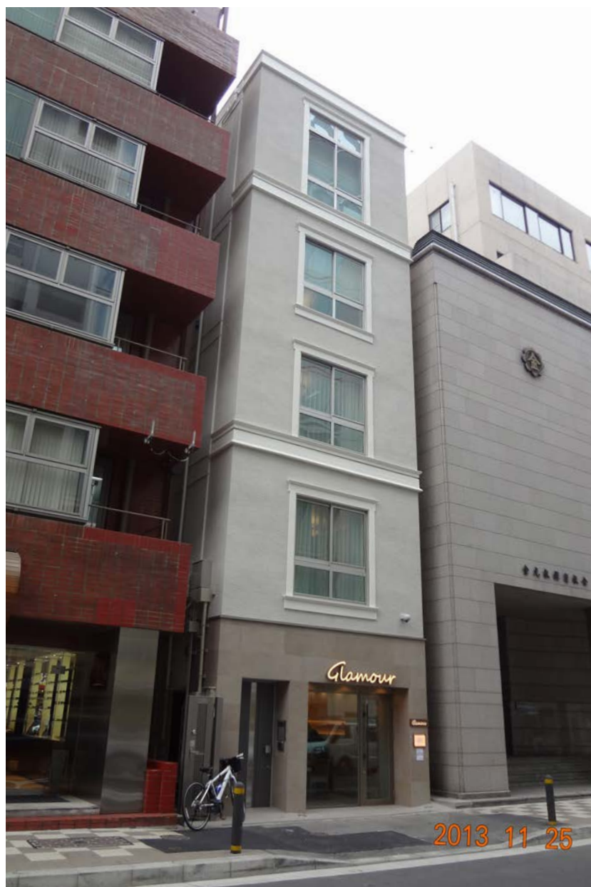
枠組み壁工法で作られた木造5階建ての外観