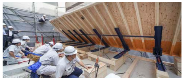
外壁の建て起こしの様子