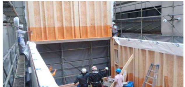
外壁パネルの設置の様子