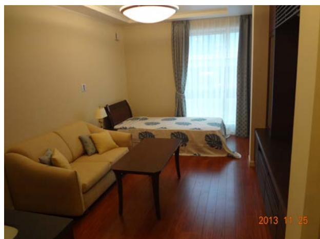
2、3階はフラット住戸