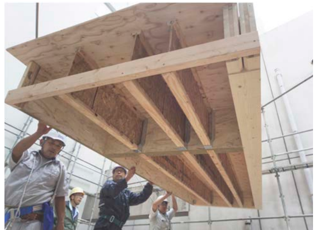
床パネルの建て込み風景