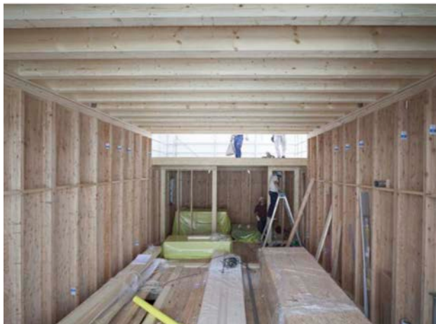
壁パネル・床パネルの設置完了状況