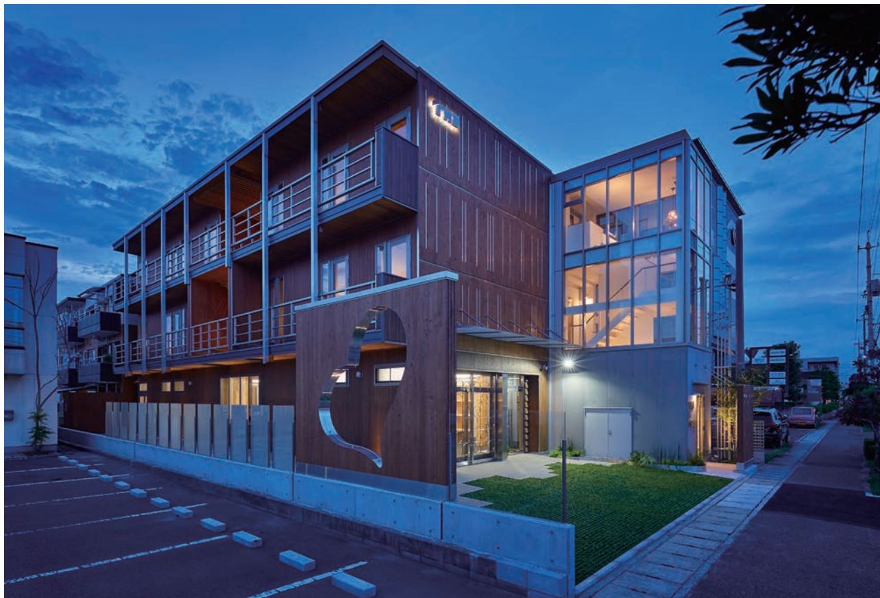
東側からの外観（夕景）