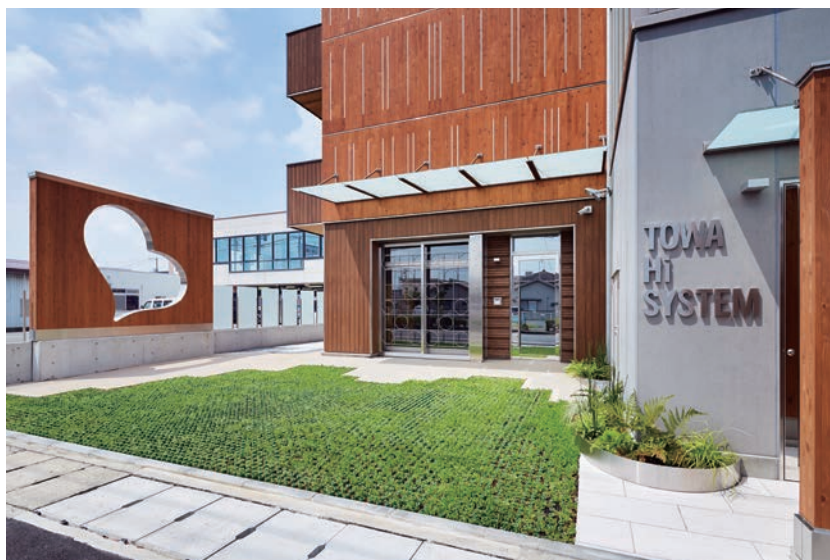
エントランスまわり外観