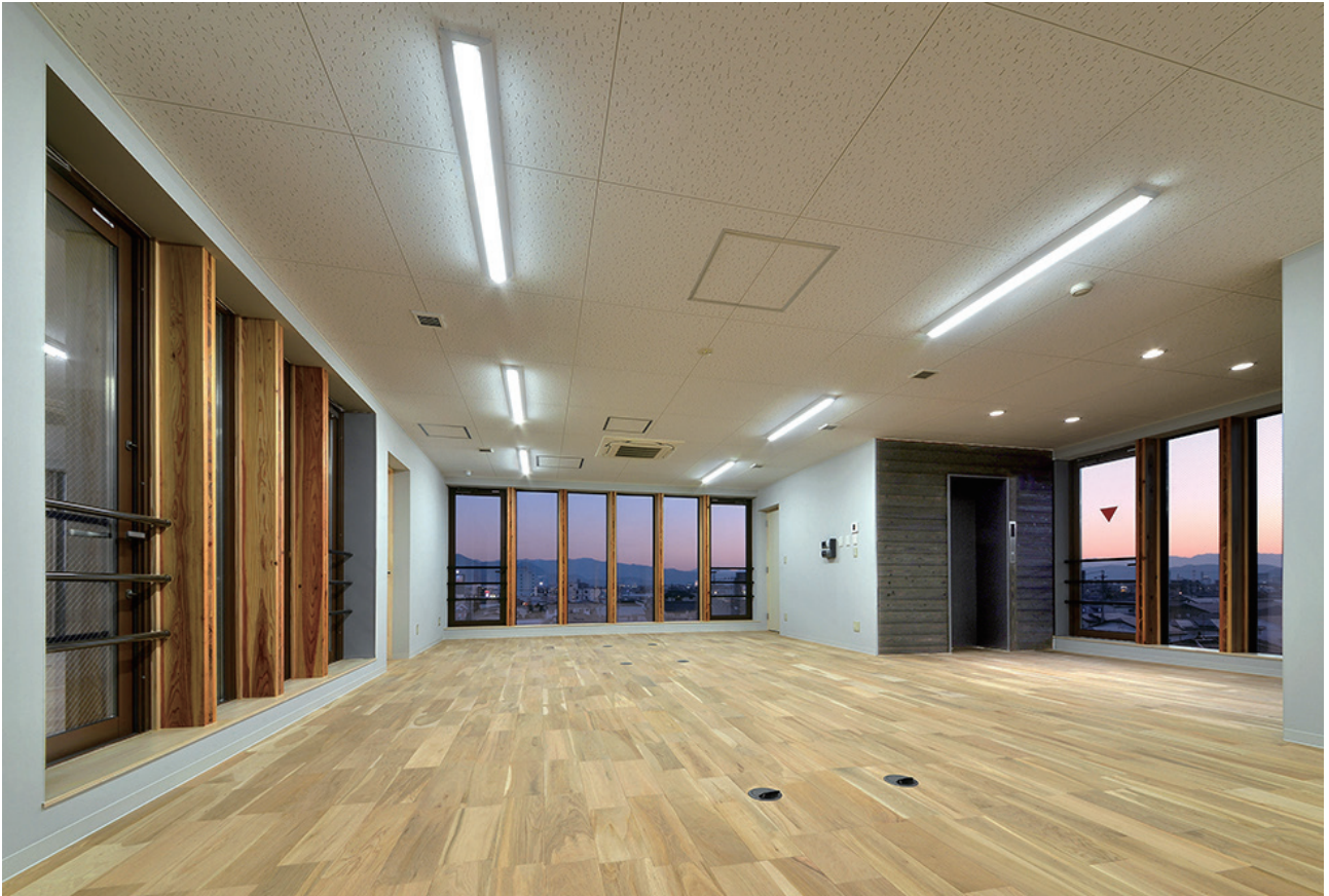
4階事務所内観 サッシュ方立に CLT 材を採用