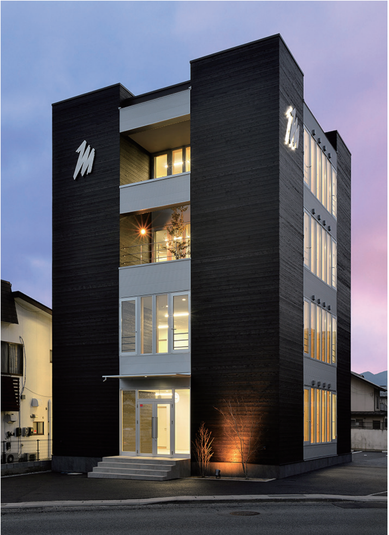
北東面外観（夕景）。外装仕上げ材は焼杉（ノブラシ）