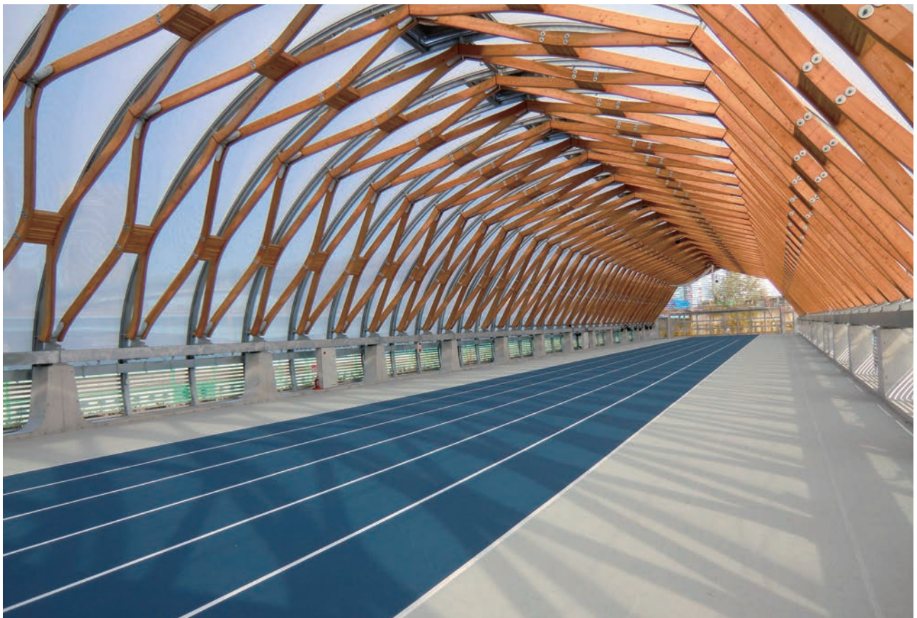
60mトラックを包みこむ18mスパンのアーチ構造の内観