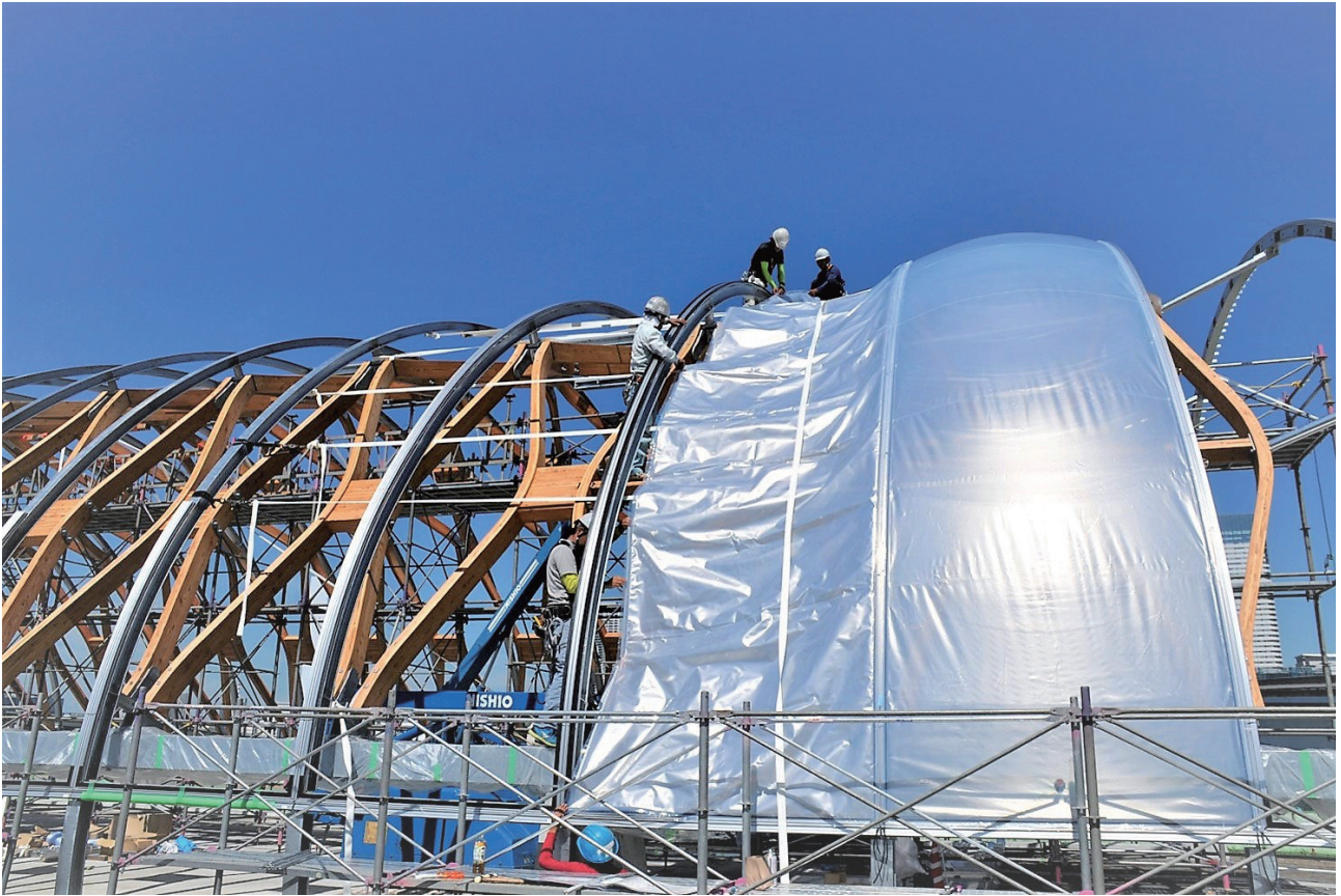
構造フレームの外観。外装のETFEの取り付けの様子