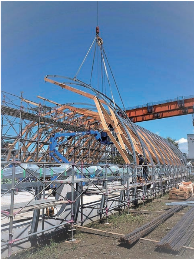
構造フレームの建て込み風景