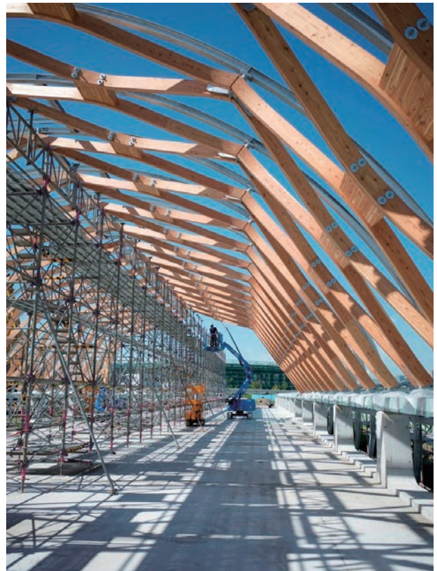
構造フレームの内観